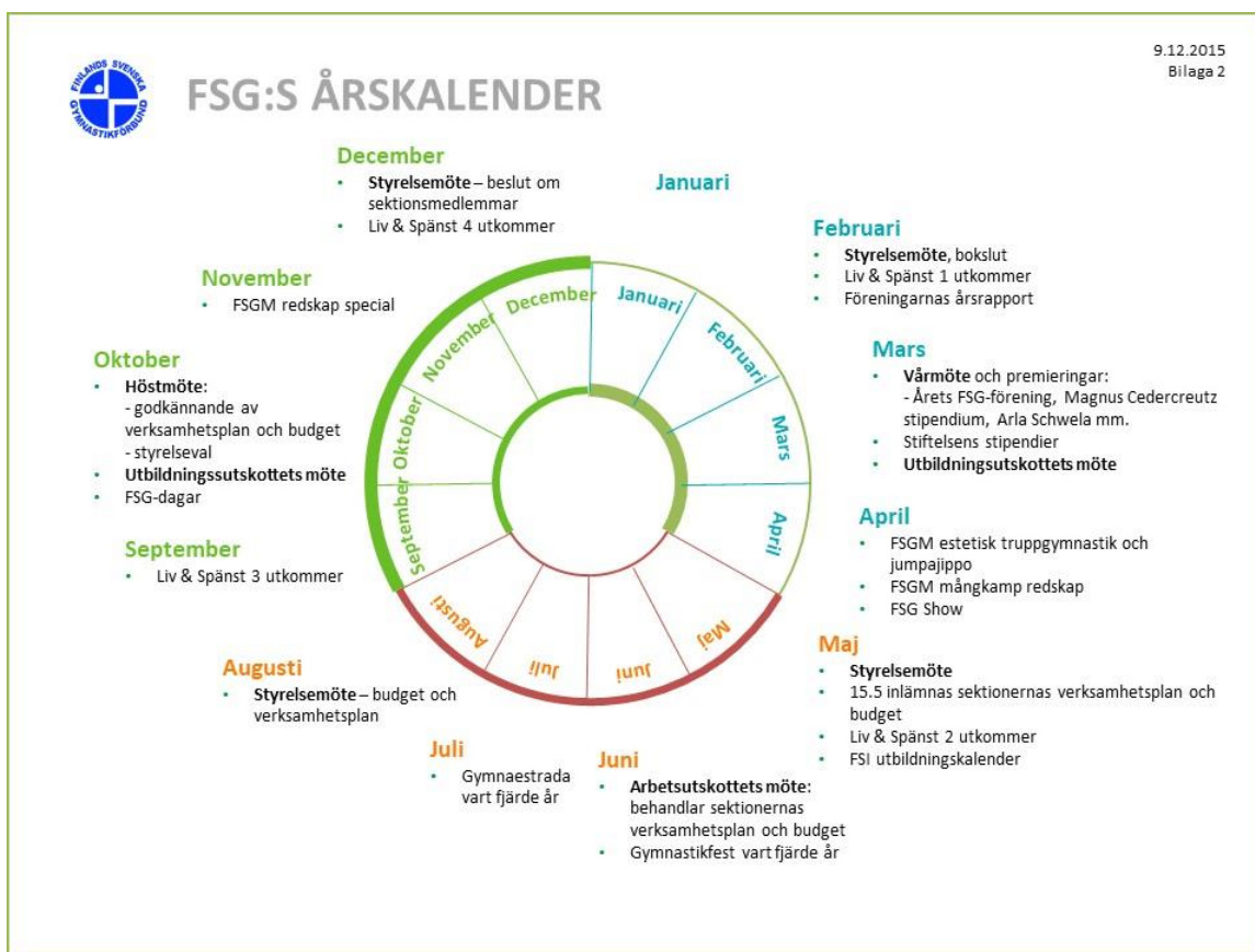
Bild 2. Årskalender för verksamhetsplanering

Sektionerna inkommer senast 15 maj med ett förslag för det kommande årets verksamhet. I samråd med verksamhetsledaren och koordinatörerna budgeteras önskade verksamhetsformer, som förbereds av styrelsens arbetsutskott i maj-juni varefter styrelsen behandlar det kommande årets verksamhet på sitt möte i augusti. Verksamhetsplanen och budgeten godkänns på FSG:s höstmöte. För att sektionerna ska vara insatta i hur hela förbundets verksamhet ser ut sänds sektionsmedlemmarna inför höstmötet förbundets verksamhetsplan och budget samt inför vårmötet verksamhetsberättelse och bokslut för kännedom.